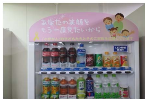
本社事務所に設置した自動販売機

認定NPOである同団体の活動趣旨に賛同し、本社事務所に小児がん支援の自動販売機を設置しました。これにより売上の一部が寄付され小児がん経験者の就労支援に使われています。