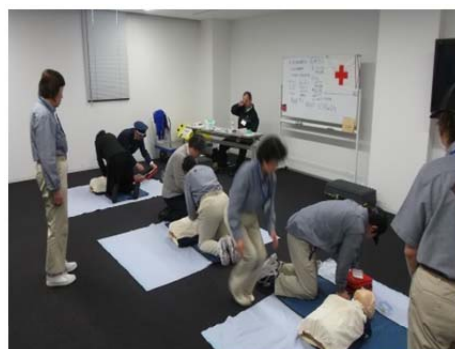
事業所での講習風景