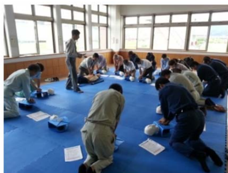
糸魚川二幸での講習風景

昨今、取引先をはじめ多くの施設へのAED設置が増えていることから、一人でも多くの従業員が緊急時に救命処置による人命救助が行えることで、社会貢献できるよう努めています。