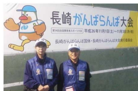
手話のボランティアとして参加

2015年11月1日～3日までの3日間、長崎で開催されました「全国障害者スポーツ大会 長崎がんばらんば大会」へ手話のボランティアとしての参加しています。