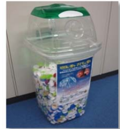
本社設置の回収箱

継続して活動している「エコキャップリサイクル運動」について 2014 年度もグループで約 6,000 個のペットボトルキャップの回収を行い、6.9 人分のワクチン募金とリサイクルによるCO2 削減など社会貢献に寄与しています。